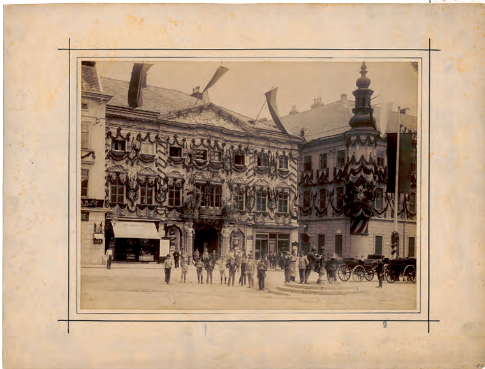
Palác šlechtičen při návštěvě Františka Josefa I. v Brně v roce 1892.

dnes již 207 letá historie Moravského zemského muzea je jako košatý strom s celou řadou hlubokých, byť často zapomenutých kořenů. Některé však z času na čas opět obrázejí „novými“ výhonky. Portfolio muzea je tak neustále naplněno desítkami zajímavých témat, výzkumů, výstav a publikací, ale rovněž galeriemi inspirativních osobností procházejících desetiletími jeho historie a budovami s ní spojenými. Leckteré přitom dodnes formují tvář i kulturní povědomí nejen starobylého města Brna, ale často celého prostoru historické Moravy. Mnohé pak s sebou nesou svou podnětnou a bohatou historii, kterou taktéž vnímáme jako nedílnou součást souhrnné minulosti našeho muzea. Proto zde dnes naplňujeme jeden z dlouhodobých dluhů vůči této části naší vlastní historie jako muzea.