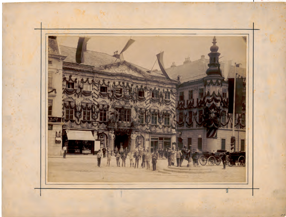
Palác šlechtičen při návštěvě Františka Josefa I. v Brně v roce 1892.