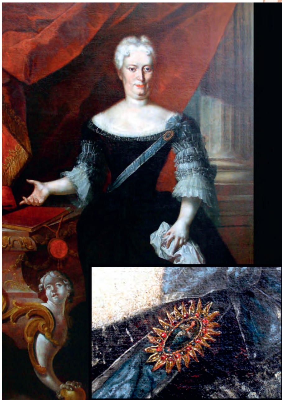
Obr. 2. Zuzana svobodná paní z Tiefenbachu – Walterskirchenu (1699–1721), první představená ústavu, portrét s detailem jejího odznaku. Horácká galerie v Novém Městě na Moravě.