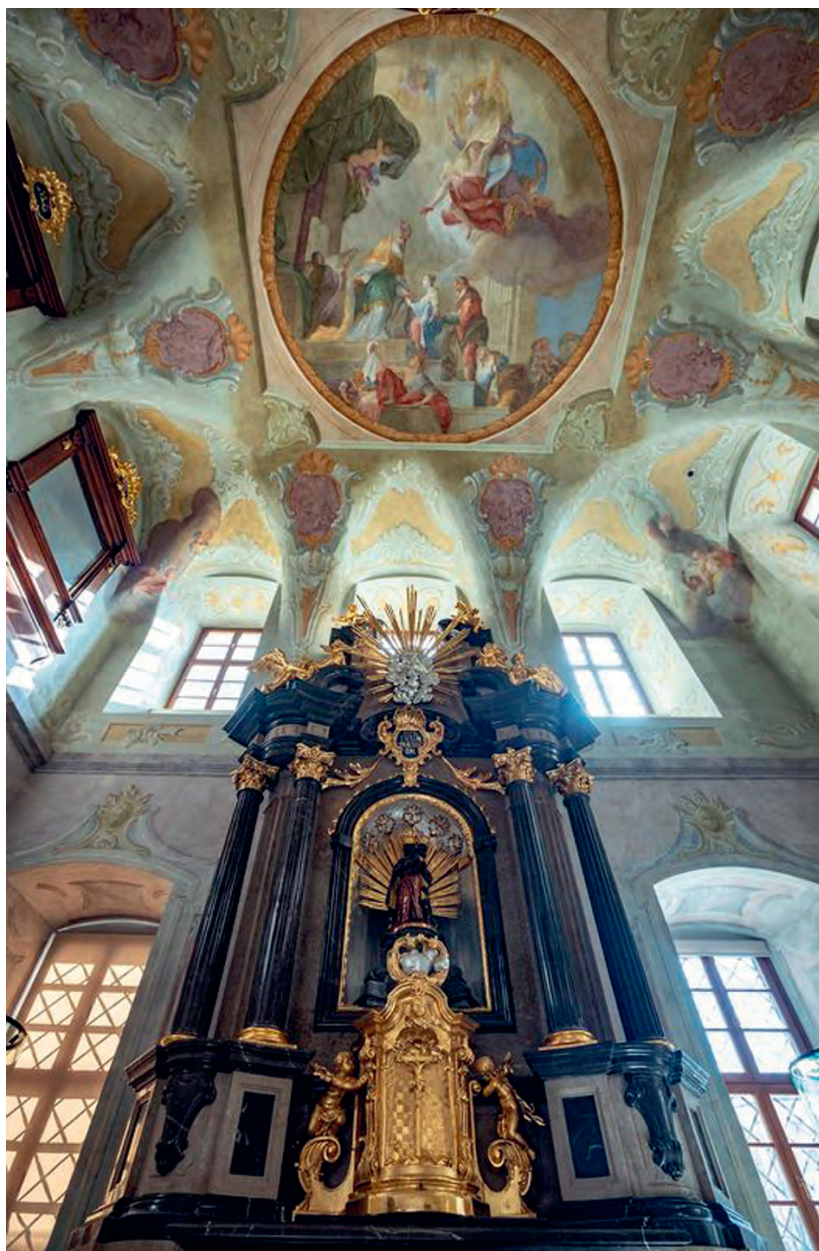
Interiér kaple Paláce šlechtičen, 2023.