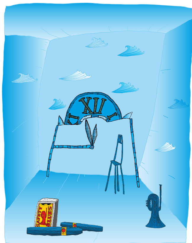
Konec starých časů