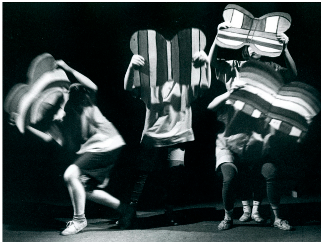
Pohádka O ztracených barvičkách