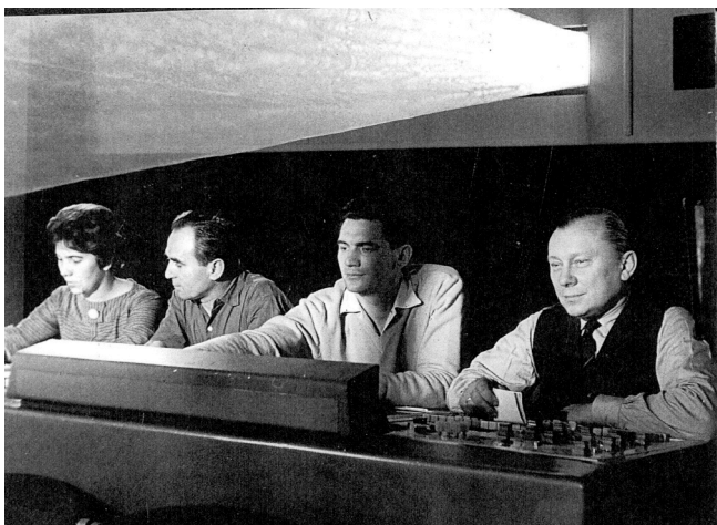
Při práci na filmu Karla Zemana s názvem Baron Prášil