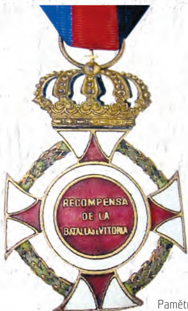
Pamětní medaile na vítězství u Vitorie 1813-1913.