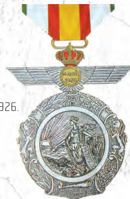
Letecká medaile 1926.