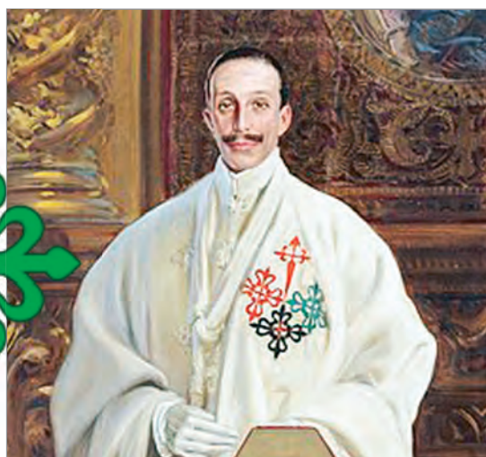
Alfons XIII. Jako velmistr rytířských řádů.