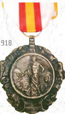
Vojenská medaile 1918.