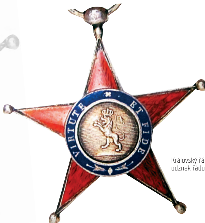
Královský řád Španělska odznak řádu – revers.