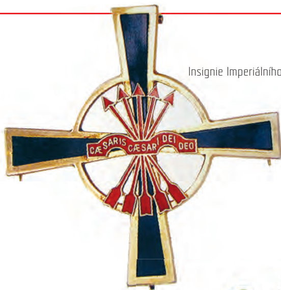
Insignie Imperiálního řádu jha a šípů.