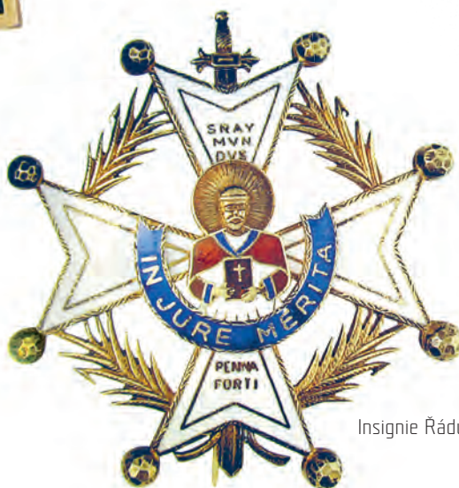
Insignie Řádu kříže sv. Raimunda de Peñafort.

sňatkem položili základy spojeného moderního Španělska. Fašizující Falanga si tento historický symbol vzala za svůj znak. Stranický znak se ztotožnil s výtvarnou podobou řádu. Stranické vyznamenání nepřezilo frankistickou epochu. Je příznačné a výsměšné, že jeden z prvních frankistických řádů je Sociální řád za zásluhy ve vězeňství – La Orden del Mérito social penitenciario z r. 1944. Je to zjednodušený řád, sestávající ze dvou křížů – zlatého a stříbrného a tří medailí – zlaté, stříbrné a bronzové. Jeho symbolika je zajímavá: na hvězdicové podložce v barvě kovu je položen modrý liliový kříž se středovým medailonem. V medailonu je postava Panny Marie Milosrdné a okolo je latinský opis MATER CAPTIVORUM ( Matka zajatých ). Civilní řád zdravotnictví – La Orden Civil de Sanidad byl založen 1943, realizován r. 1944 a má čtyři třídy (velkokříž, velkodůstojníka, komandéra, rytíře) v obvyklém uspořádání. Insignií řádu je bíle smaltovaný kříž maltézského typu s heraldickou náplní středového medailonu oválného tvaru. Zajímavou historii má Civilní řád Alfonse X. Moudrého – La Orden Civil de Alfonso X. Sabio . Ten navazoval na dřívější řád z r. 1902 Orden de Alfonso XII . Nyní byl obnoven pod jiným jménem, založen byl r. 1939, ale k realizaci došlo až r. 1945. Jeho smyslem bylo odměňovat zásluhy ve vzdělání, výuce, umění a vědě. Na reversu insignie je řádové heslo ALTIORA PETO – Mířím výše .