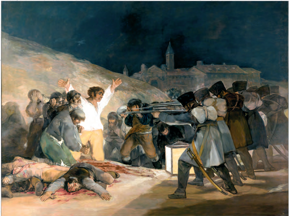
Goya: Tres de Mayo 1808 (Prado – Madrid – reprodukce).