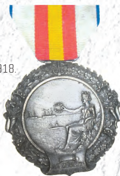
Námořní medaile 1918.