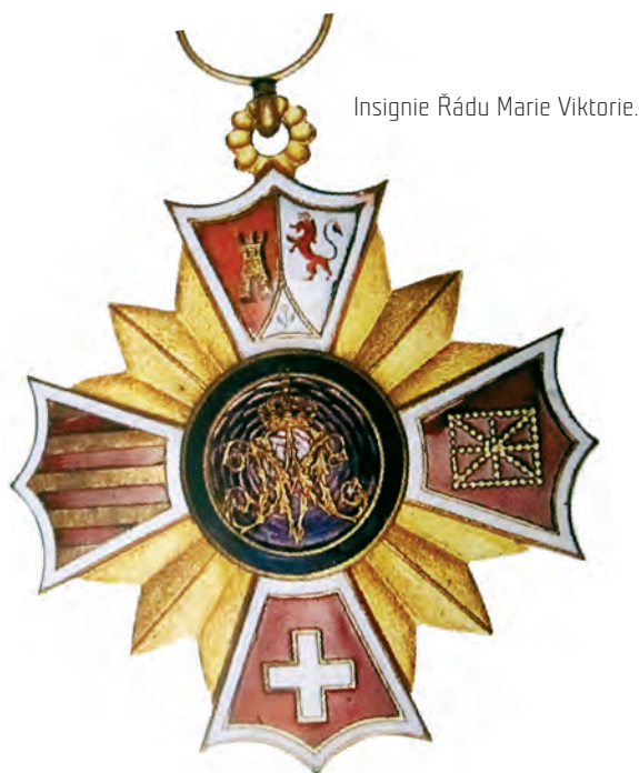
Insignie Řádu Marie Viktorie.

Revoluční období bylo faleristicky plodné. Prozatímní vláda reformovala Isabelin řád Merito Militar a na jeho reversu, kde byl monogram královny Y2, změnila na zkratku názvu řádu MM (udržela se po celá další období). Král Amadeo I. přišel hned při nástupu na trůn s novým civilním řádem, pojmenovaným podle své manželky Řád Marie Viktorie – La Orden de Maria Victoria . Řád měl odměňovat celou škálu činností od lékařství přes průmyslová odvětví až po jednotlivé disciplíny věd a umění (jednotlivé obory byly vyjádřeny barvami stuhy, insignie se neměnila). Řád je nesmírně vzácný, jelikož trval krátce a zanikl abdikací krále. Amadeo však založil během své krátké vlády ještě několik vyznamenání – pro městskou milici, pro dobrovolníky tažení na Kubu nebo námořníky flotily Středozemního moře. Všechna Amadeova vyznamenání jsou snadno rozpoznatelná, protože je na nich znázorněn bílý savojský kříž. Ani 1. republika nevyzněla naprázdno. Z jejího období jsou známé medaile bojovníků z Kubu, z bojů proti kantonalistům (tj. zastáncům samostatnosti určitých území) a z karlistické války.