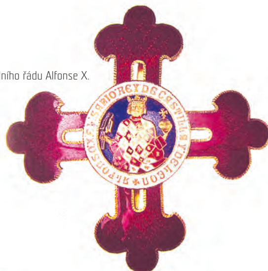
Insignie Civilního řádu Alfonse X. Moudrého.