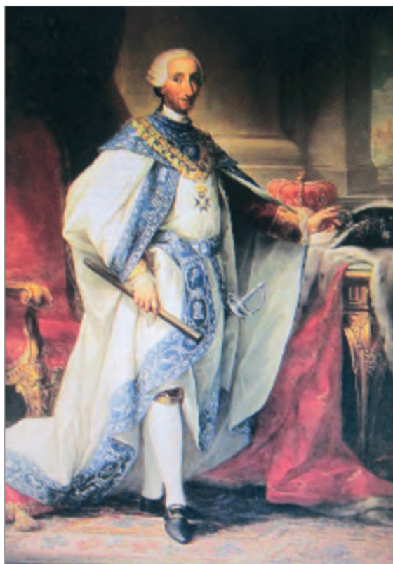
Karel III. v oděvu velmistra svého řádu.