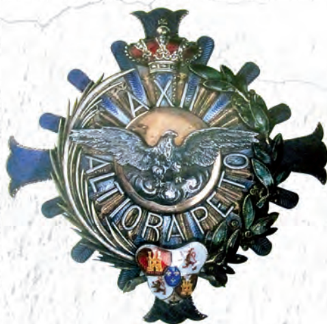
Insignie Civilního řádu Alfonse XII.