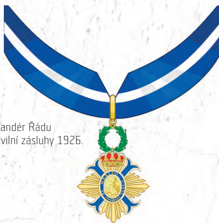
Komandér Řádu za civilní zásluhy 1926.