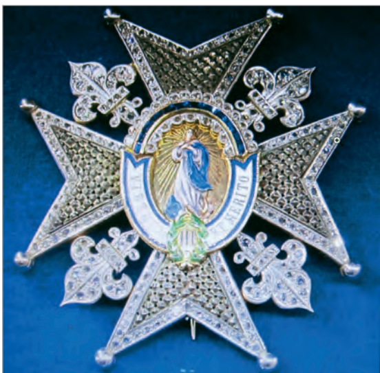
Insignie Královského a vznešeného řádu Karla III.

Karel III. zemřel v prosinci 1788 ve věku 72 let. Jeho působení na trůně je hodnoceno španělskými historiky většinou pozitivně. Je považován za zakladatele moderního španělského národa. Za jeho vlády se obecným státním jazykem upevnila kastilština, kterou nyní všeobecně nazýváme španělštinou. Státu dal hymnu a vlajku, kterou Španělsko užívá dodnes: široký střední žlutý pruh má nahoře i dole červené pruhy poloviční šířky (na středním žlutém pruhu je položen státní znak, který se podle státního zřízení měnil). Zmodernizoval také hlavní město Madrid, které nese dodnes do svého půdorysu urbanistické zásahy tohoto osvíceneckého krále.