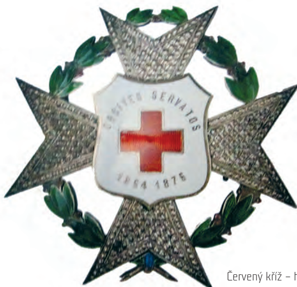
Červený kříž - hvězda 1866.