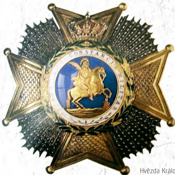
Hvězda Královského a vojenského řádu sv. Hermenegilda.